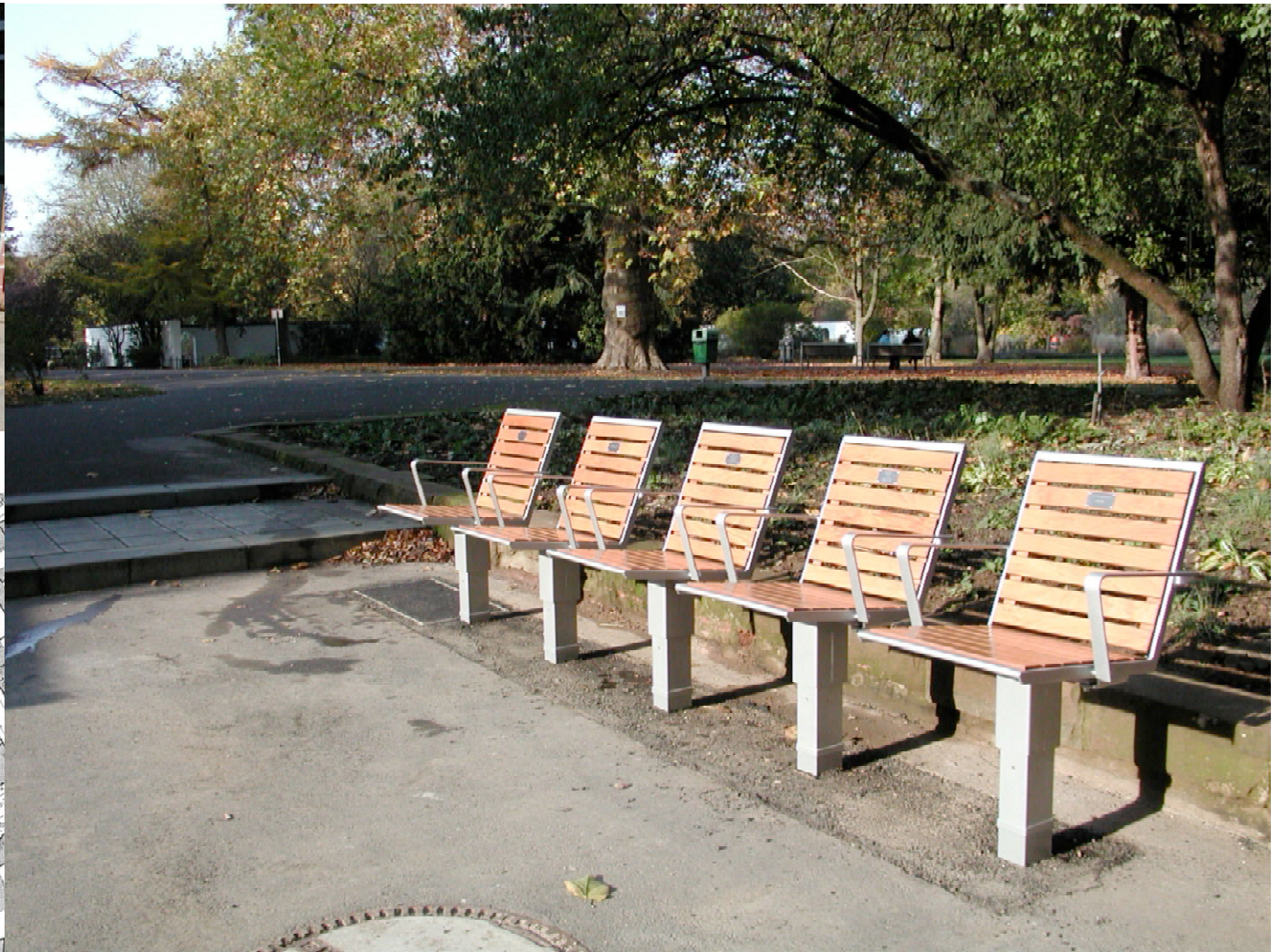
reiner hofmann zwischen den stühlen standort: hinter parcside-komplex am stadtpark